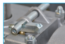
POSSIBILITÀ DI COLLEGARE LO SBLOCCO VIA CAVO POSSIBILITY TO CONNECT THE CABLE UNLOCKING DEVICE