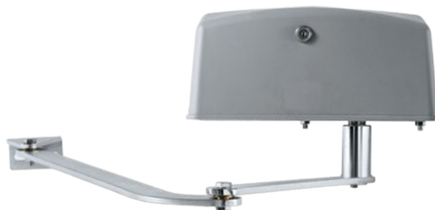
BRACCI SNODATI IN ACCIAIO STEEL ARTICULATED ARMS

MAXIART is designed with mechanical components entirely made of metal to ensure the integrity of the product over the years. Galvanised steel shell designed for maximum ease of installation and minimum space requirement. Recommended control units: BIOS2 / 12006515 and BIOS2 ECO / 12006531.