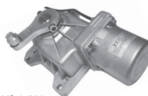
INT VS 24Vdc

STRUCTURE EN ALUMINIUM MOULÉ SOUS PRESSION CAPABLE DE SUPPORTER GRANDS EFFORTS ESCRUCTURA DE ALUMINIO FUNDIDO PARA SOPORTAR GRANDES ESFUERZOS