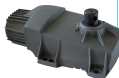
INT R/XL 230Vac

MOTORÉDUCTEUR DE HAUTE QUALITÉ MOTORREDUCTOR DE ALTA CALIDAD