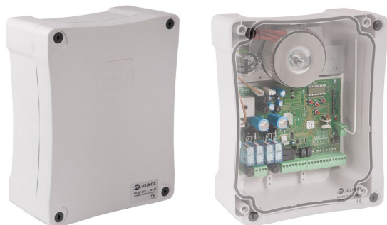
Centrales BIOS2 / BIOS2 24V Cuadros BIOS2 / BIOS2 24

Diversas opciones de ajuste de los movimientos y control total de los dispositivos de seguridad. El radio receptor 433.92MHz está integrado en todos los cuadros de mando BIOS