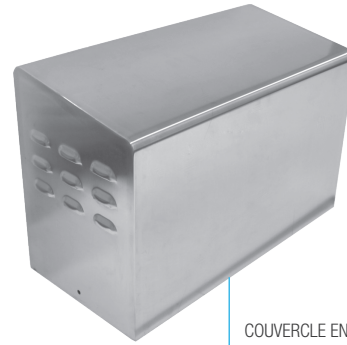
COUVERCLE EN ACIER INOXYDABLE TAPA DE ACERO INOXIDABLE

Operador ideal para cancelas correderas industriales de hasta 3600KG