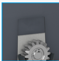
DISPONIBILE FINECORSA MAGNETICO AVAILABLE MAGNETIC LIMIT SWITCH