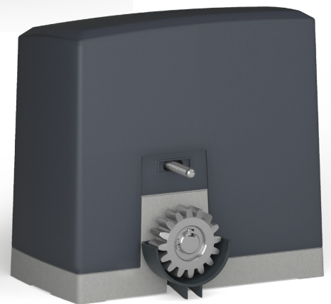
BASE TOTALMENTE IN ALLUMINIO PRESSO-FUSO. ENTIRELY DIE-CAST ALUMINIUM BASE.