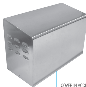
COVER IN ACCIAIO INOX STAINLESS STEEL COVER

Motor designed for very large and exceptional weight gates. I3600MAX has metal and bronze mechanical components and an advanced system for maximal cooling efficiency that ensures an optimal use even in the most critical situations, always keeping a smooth and precise movement, also thanks to the revolutionary integrated electronic control system. Available in 230Vac. Built to last. Ideal operator for industrial sliding gates up to 3600KG.